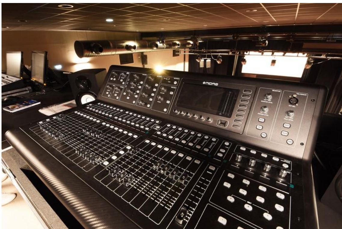
Console Numérique MIDAS M32