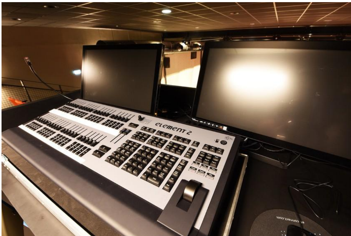
Console EOS element 2